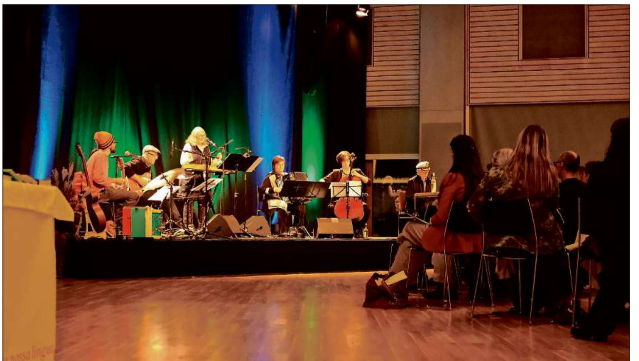
Impressiun da la saira durant il concert da la super-group rumantscha.